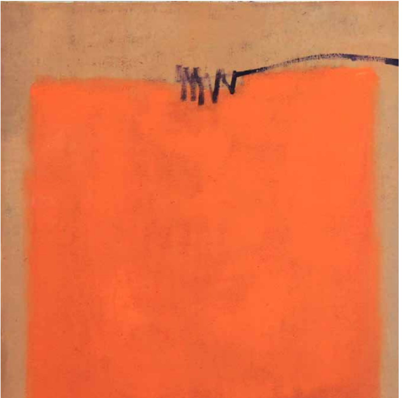
Óleo sobre lienzo 60cm x 60cm