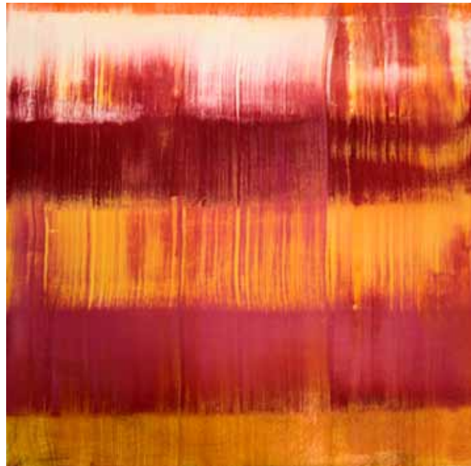
Óleo sobre lienzo 30cm x 30cm