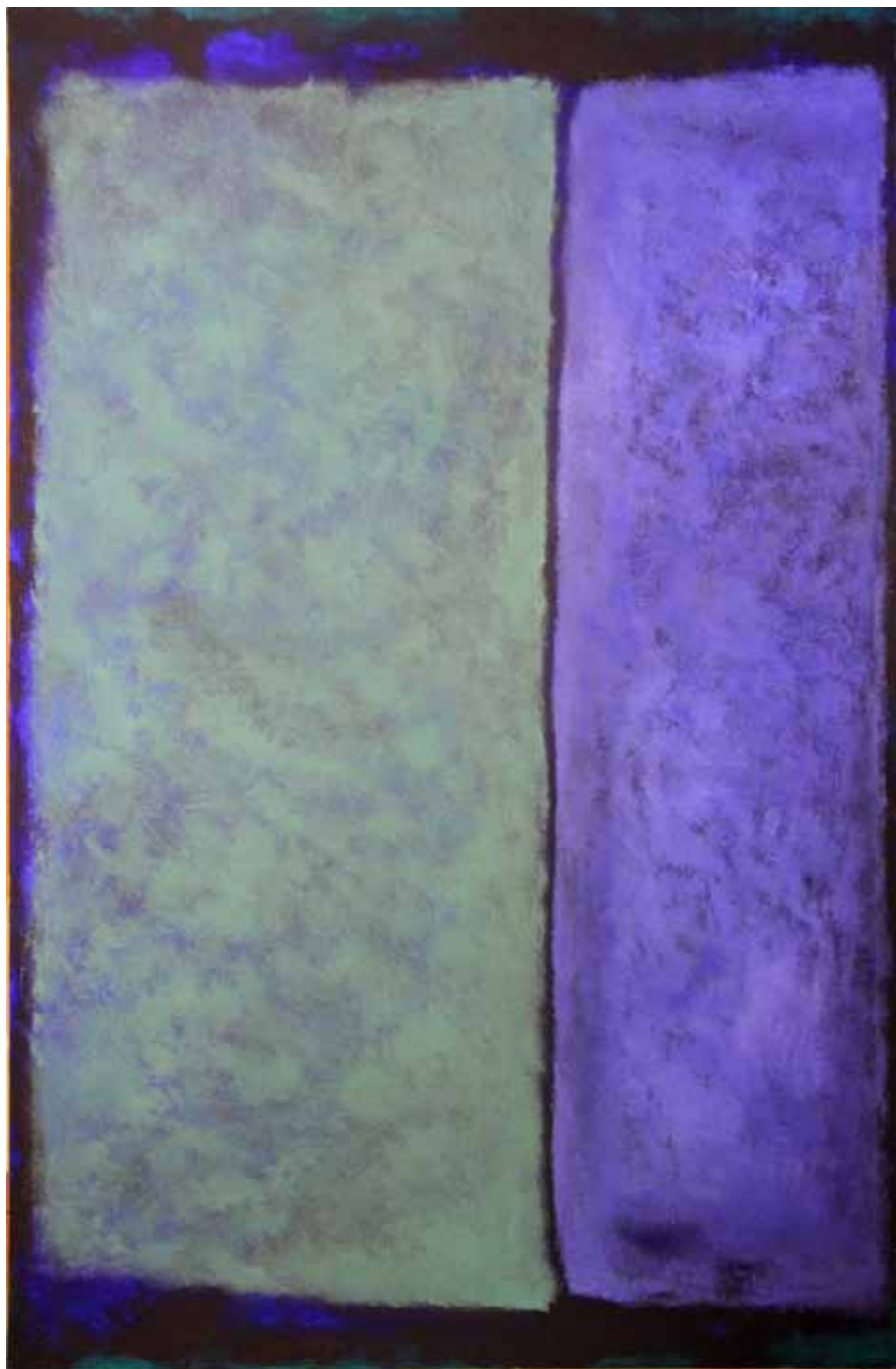
Óleo sobre lienzo 195cm x 130cm