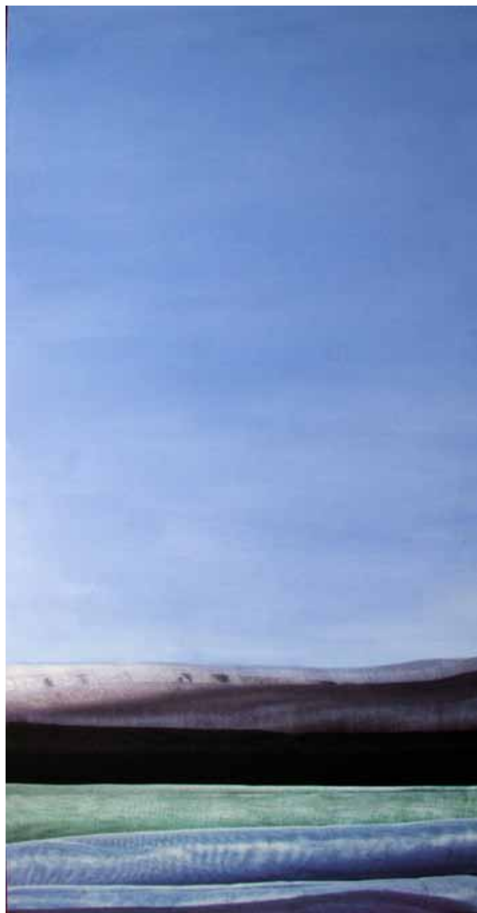
Óleo mas impresión digital con tintas pétreas sobre lienzo 60cm x 120cm