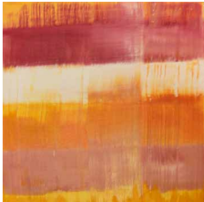
Óleo sobre lienzo 30cm x 30cm