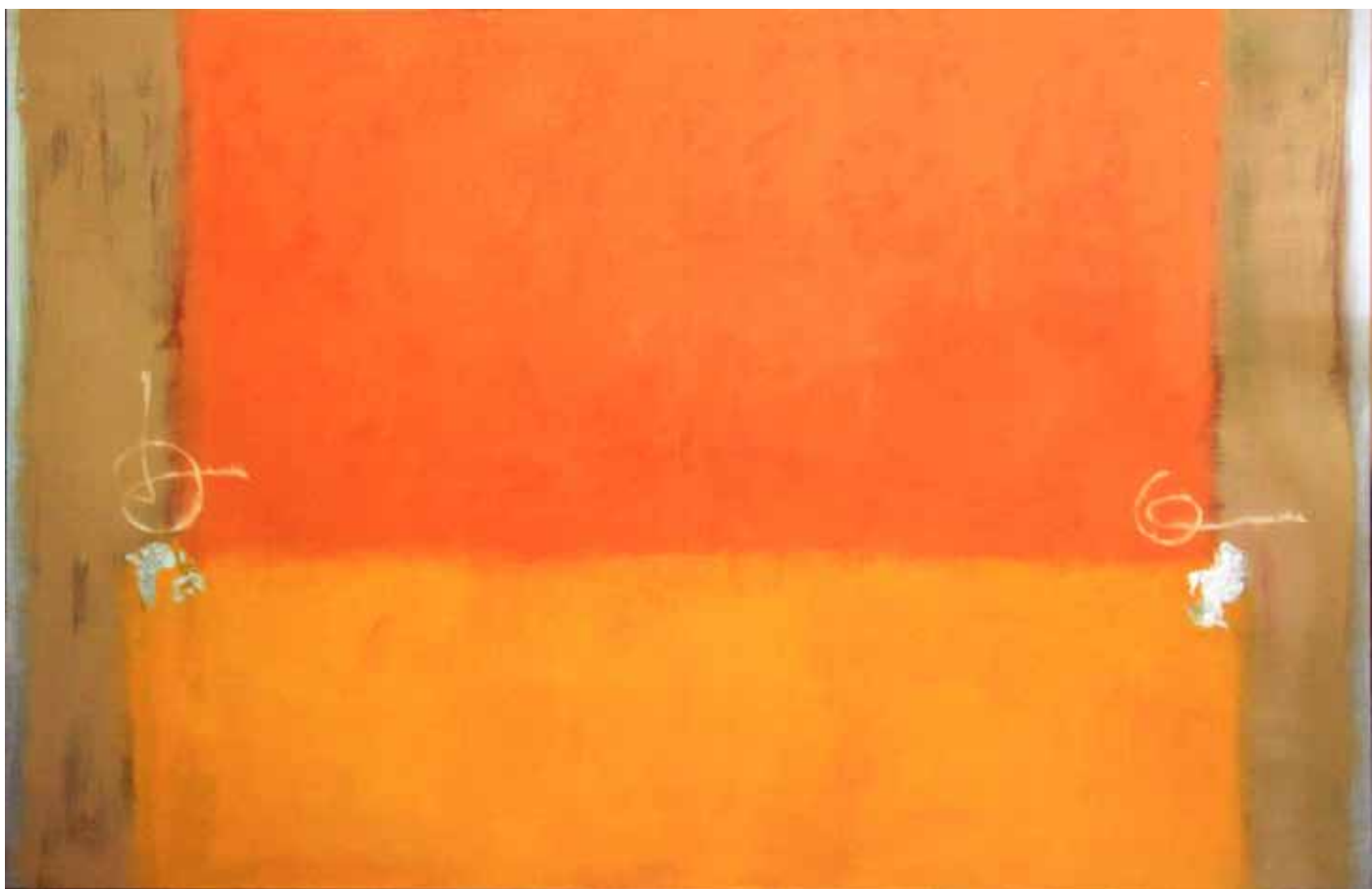
Óleo sobre lienzo 130cm x 195cm