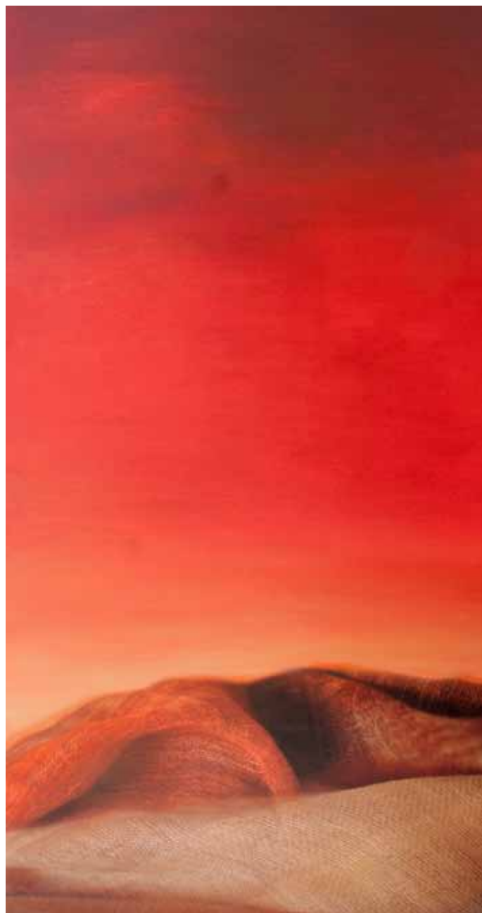
Óleo mas impresión digital con tintas pétreas sobre lienzo 60cm x 120cm