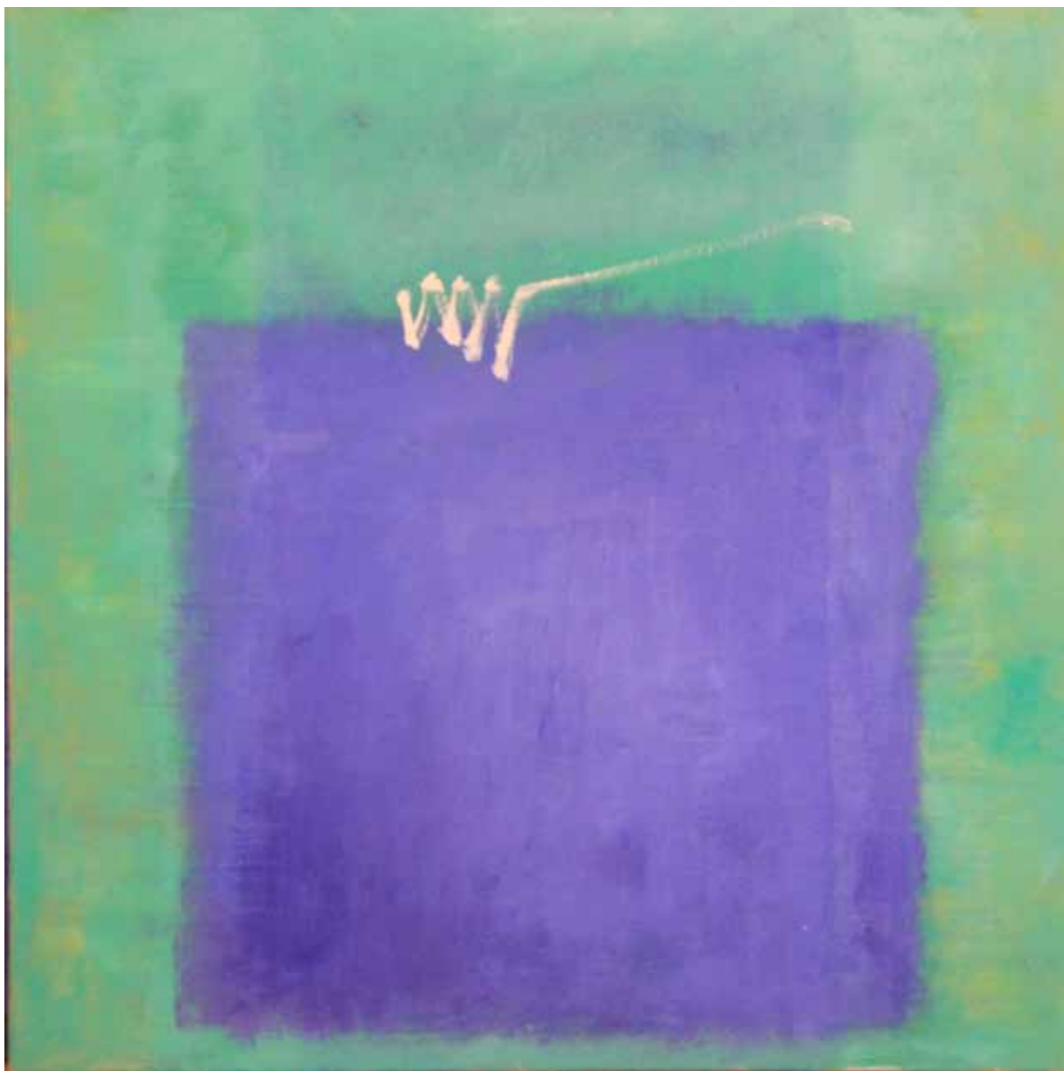
Óleo sobre lienzo 50cm x 50cm