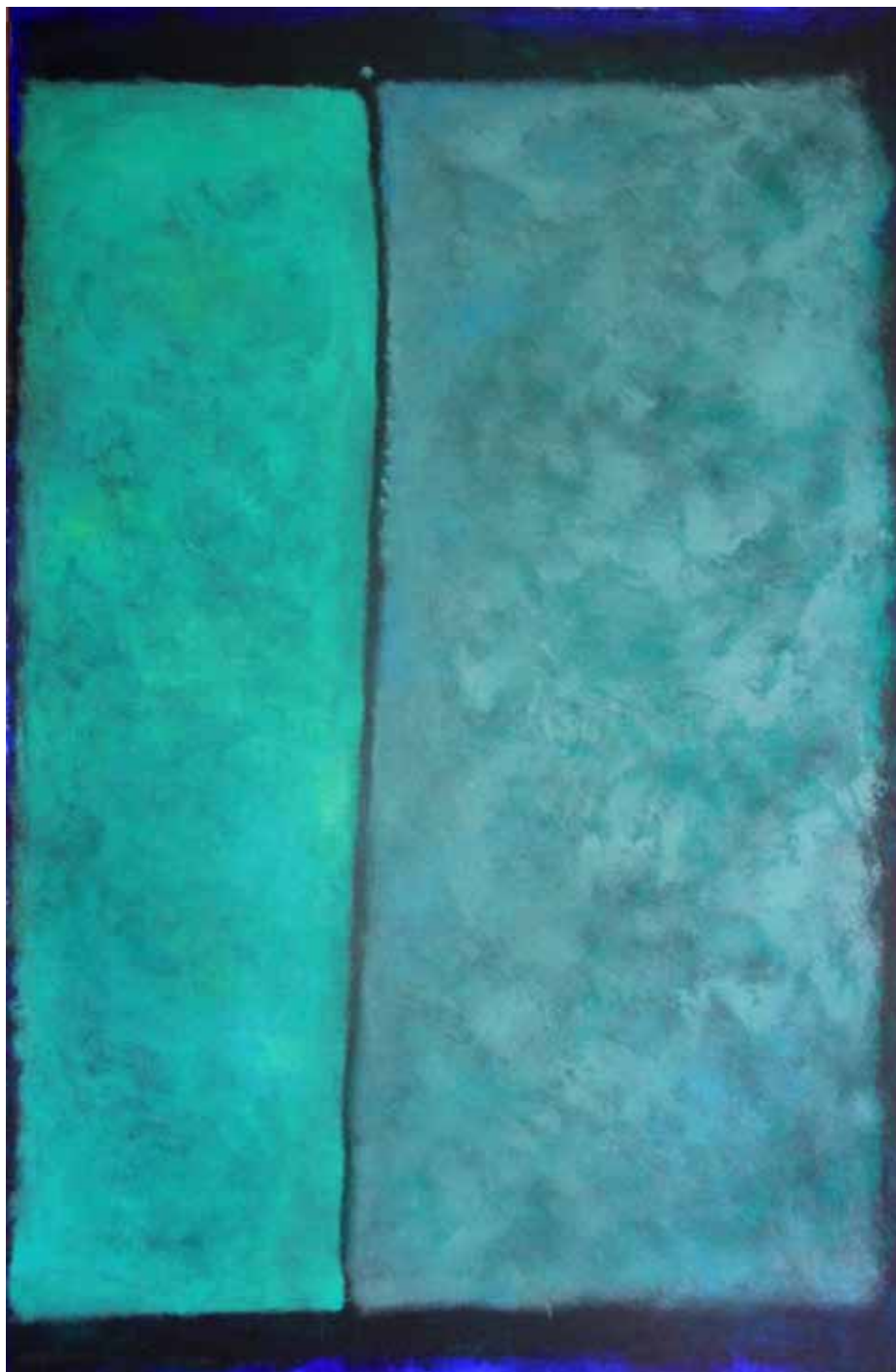
Óleo sobre lienzo 195cm x 130cm