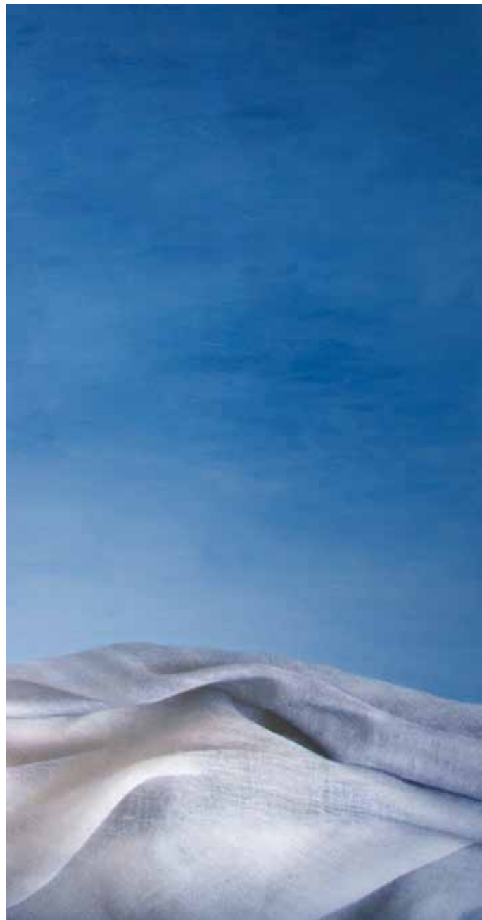
Óleo mas impresión digital con tintas pétreas sobre lienzo 60cm x 120cm