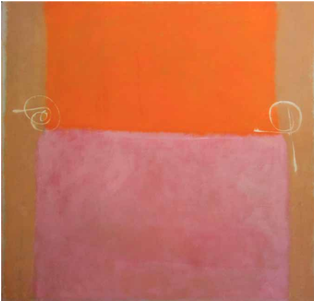
Óleo sobre lienzo 150cm x 150cm